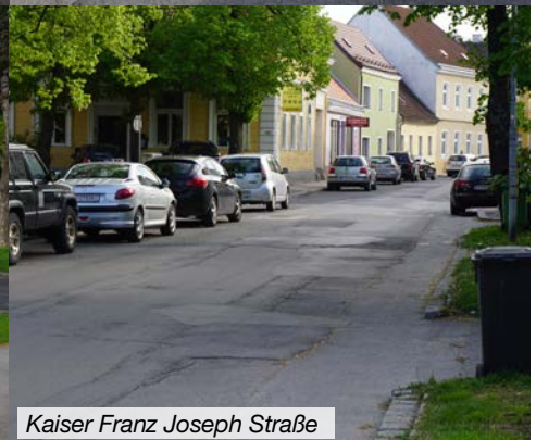
Kaiser Franz Joseph Straße