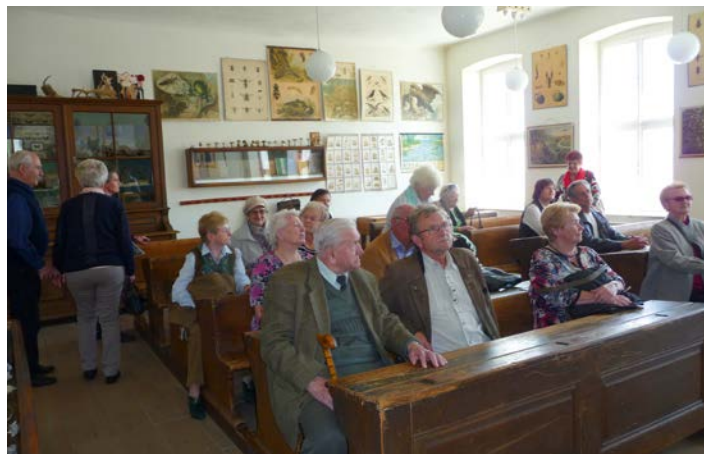
Im Michelstettner Schulmuseum wurden wir zu Schülerinnen und Schülern und erfuhren Schulgeschichte aus verschiedenen Epochen.

In den 70-iger Jahren schlossen viele Schulen im Weinviertel. Unzählige Lehrmittel und Lehrbehelfe wurden mit einem Schlag nutzlos und landeten im Museum. 2007 wurde die Michelstettner Schule wieder geöffnet und ist eine ganz besondere Schule. Im Michelstettner Schulmuseum wird die Entwicklung des Schulwesens von der Antike bis zur Gegenwart behandelt.