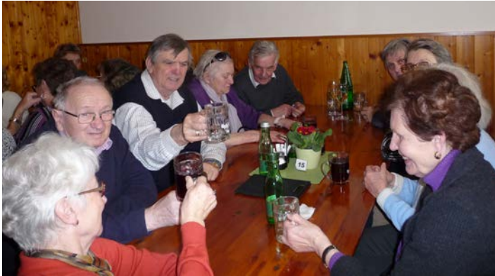
Den gemütlichen Abschluss unserer Ausflüge verbringen wir gerne beim Heurigen.

Im Mai führte unser Tagesausflug in die Firma Landgarten in Bruck / Leitha. Dort besuchten wir eine laufende BIO-Lebensmittel-Produktion. Aus Soja entstehen dort leckere Knabber- und Schoko-Snacks. Die Führung zeigt vom Kühllager, über das Veredeln mit einem patentierten Röstverfahren, das Schokolieren, die Qualitätskontrollen und die Verpackungsstraße.