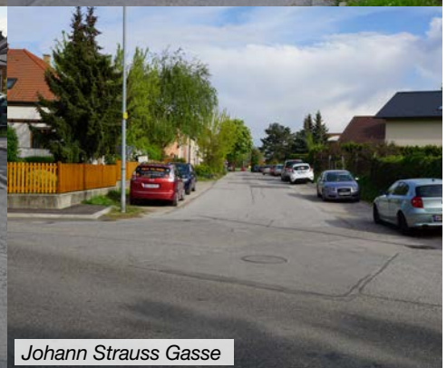
Johann Strauss Gasse